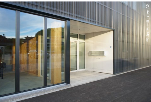
Entrée du bâtiment de Monolicht GmbH ; fenêtres à profilés placés du système SOFTLINE 82 MD

De fait, ce profilé réunit tous les critères rigoureux d'efficacité énergétique, de confort d'habitat, d'esthétique et d'économie. Sa structure, sa nature et sa modularité facilitent par ailleurs le travail : de la conception à l'assemblage – et bien au-delà de la date d'inspection des travaux finis.