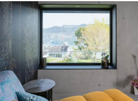
Massgefertigte Fensterfront auf der Basis von SOFTLINE 82 MD SPECTRAL graphitschwarz.